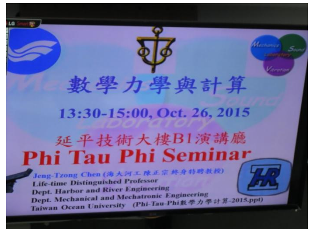
斐陶斐榮譽會員講座 數學力學與計算