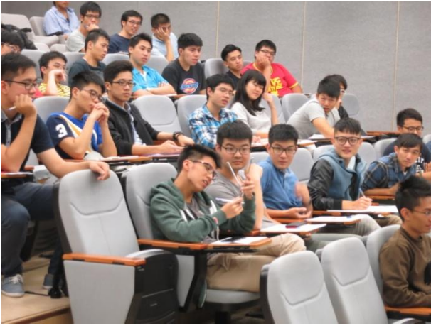
學生好奇地把玩求積儀