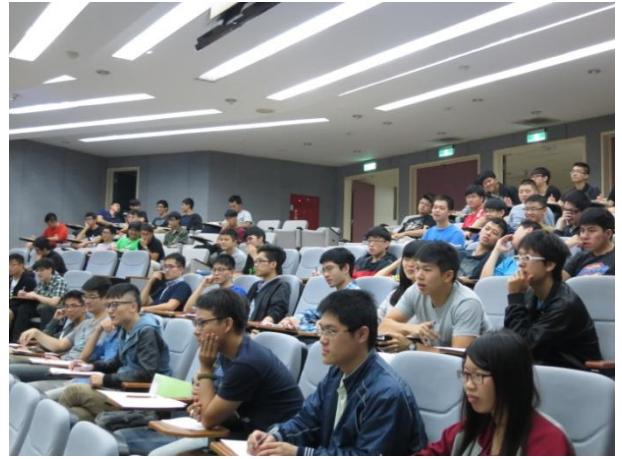
與會學生聚精會神，仔細聆聽