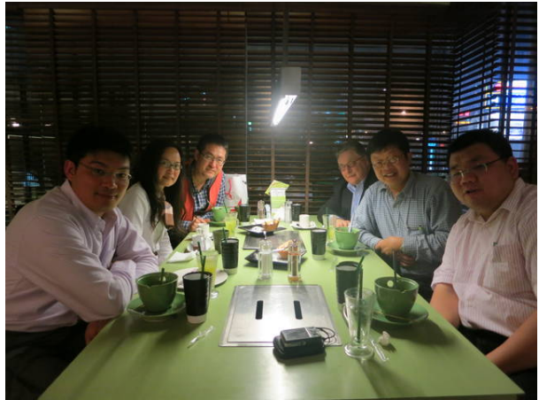
原燒晚宴合影(台中市)