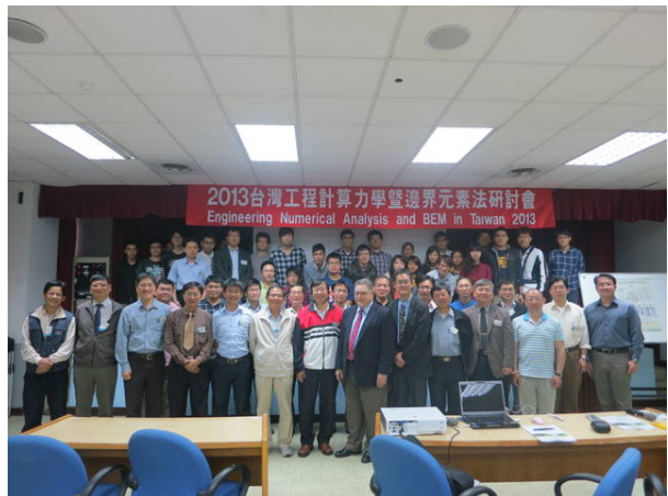
第四屆台灣 BEM 會議合影於中興土木