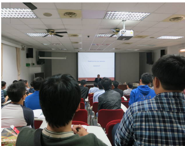
Crouch 教授發表演講(北科大土木系)