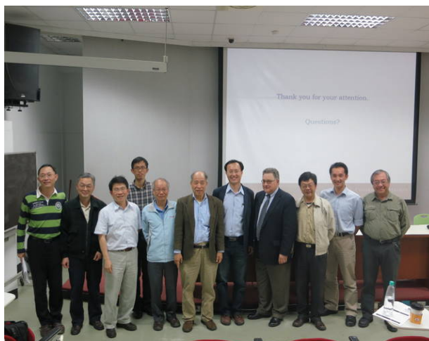
Crouch 教授會後合影(北科大土木系)