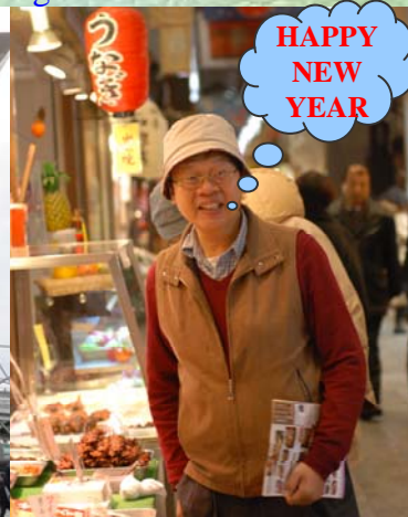
阿宗教授(京都歐吉桑)