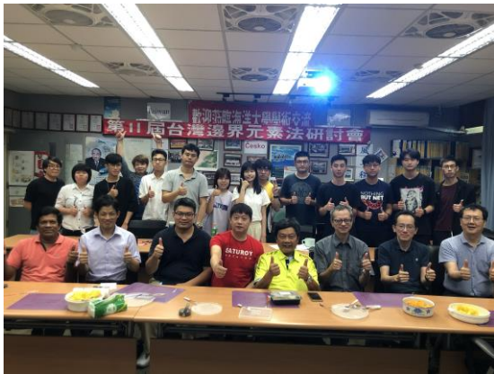
海工計算力學論壇午餐交流