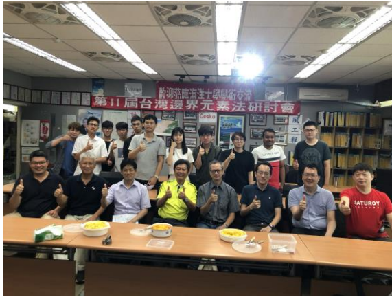
海工計算力學論壇開場合照