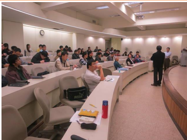
第九號宇泰講座盛況