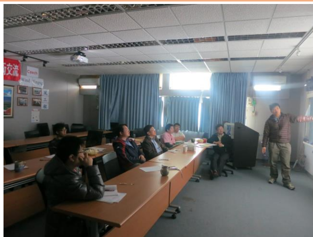
NTOU/MSV 團隊研究進度報告