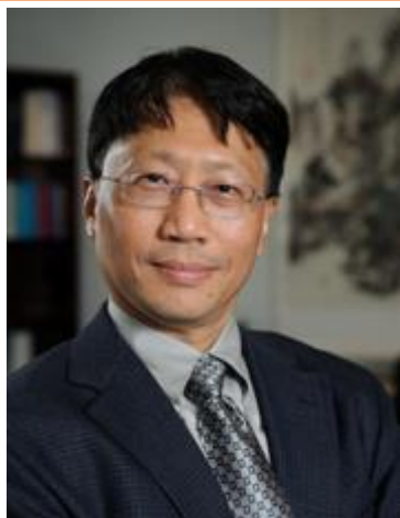
美國密西西比大學工學院院長程宏達教授 蒞臨海大進行第九號宇泰講座