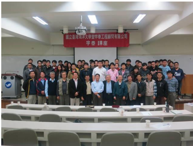
工學院一樓視聽室 全體大合照