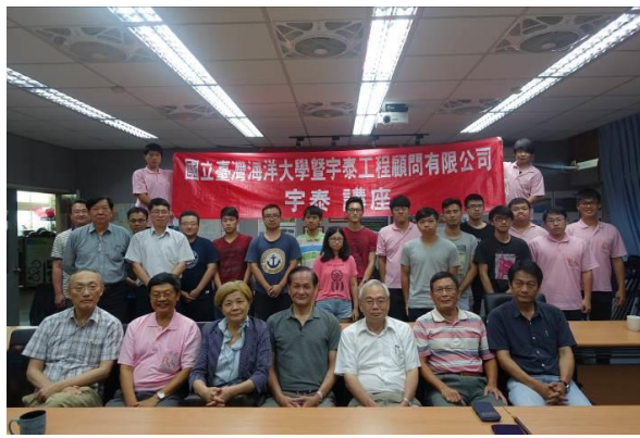
宇泰講座會後大合照