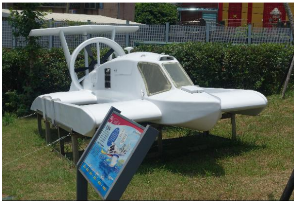
展示於海科館的飛翼船