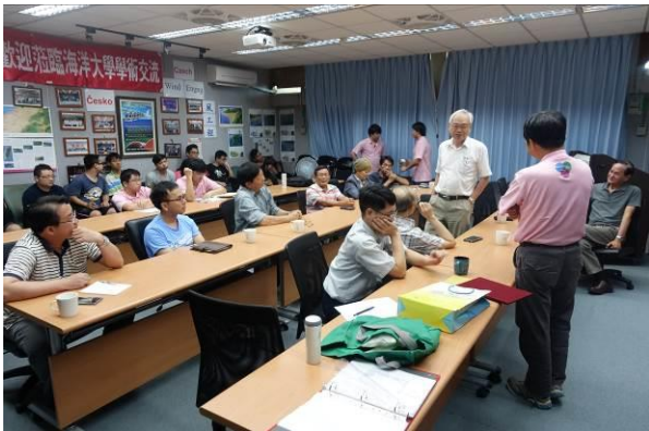
會後交流-老師介紹