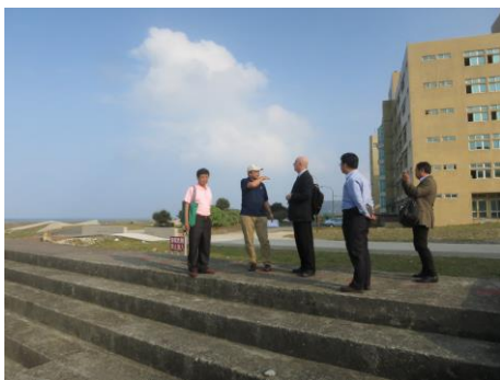
海大校園&研究室參訪