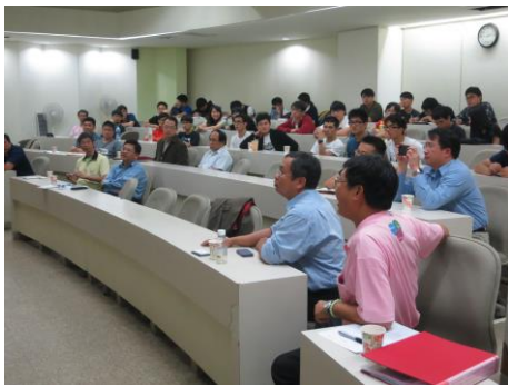
仔細聆聽大師演講/與會師生