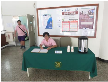
會前準備/NTOU/MSV 研究團隊