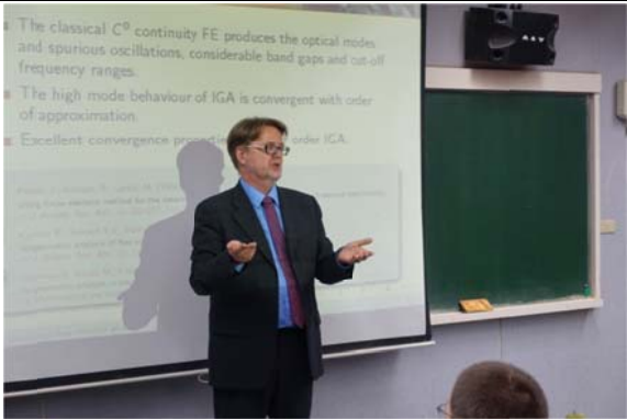
捷克科學院 Plesek 所長進行宇泰講座