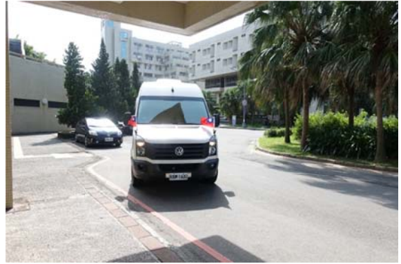
捷克訪問團專車抵達海大濱海校區