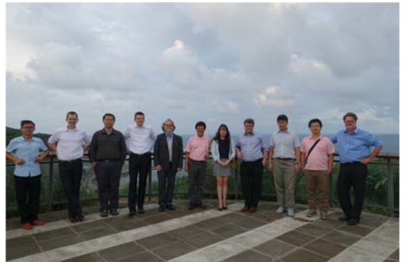
台捷雙方於容軒步道合影