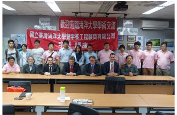
台捷雙方全體合影