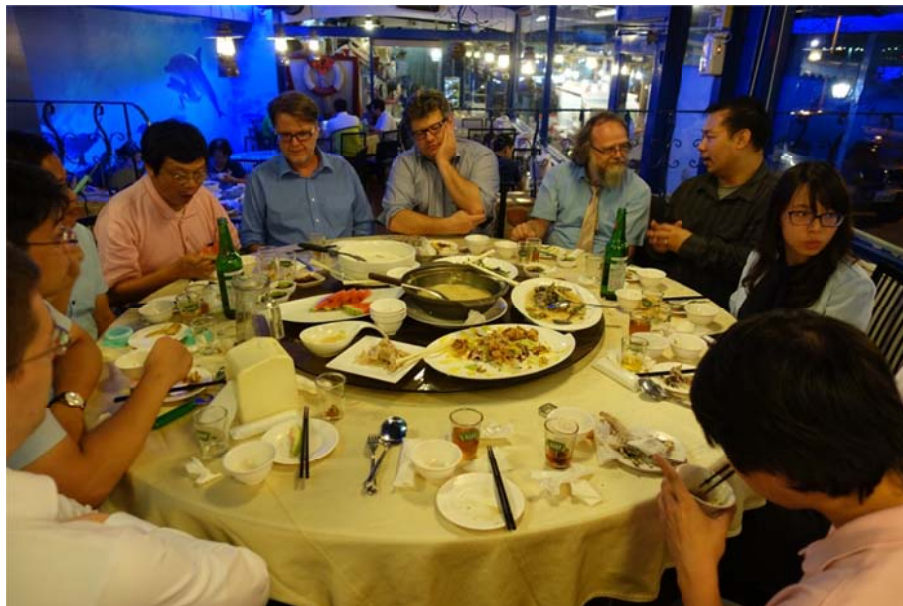
晚宴交流 賓主盡歡