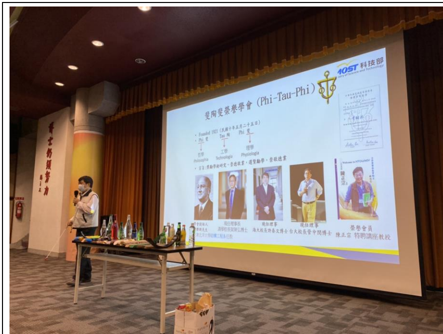
介紹 Phi Tau Phi 學會