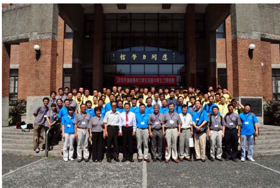
2010年海峡两岸力学交流暨中学生力学夏令营活动全体代表合影

本次活动的承办单位为台湾大学机械工程学系，协办单位为科学工艺博物馆、台湾海洋大学、宜兰大学、台湾实验研究院和高速网路与计算中心等。