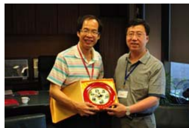
大陆代表团参访活动照片

在台期间，大陆代表团参访了台湾大学、台湾高速网路与计算中心、台湾新竹清华大学、台湾海洋大学、基隆港务局、宜兰大学以及高雄科学工艺博物馆。